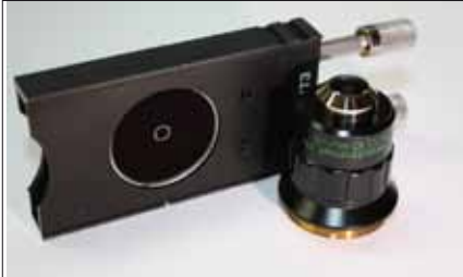
Objektiv PA PH 0,5/0,10/oo/-A + PH Schieber Sonderpreis Komplett 450,-€

Nachfolgend bieten wir Ihnen eine größere aber begrenzte Stückzahl an Objektiven für das Telval 3 + Telaval 31 von Carl Zeiss Jena zu Sonderpreisen.