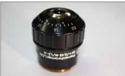
Objektiv PA LDN 20x/0,45/oo/1,2/-A 850,-€