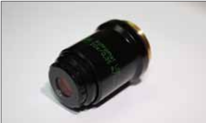
Objektiv A PH LDN 20x/0,35/oo/1,2/-A 490,-€